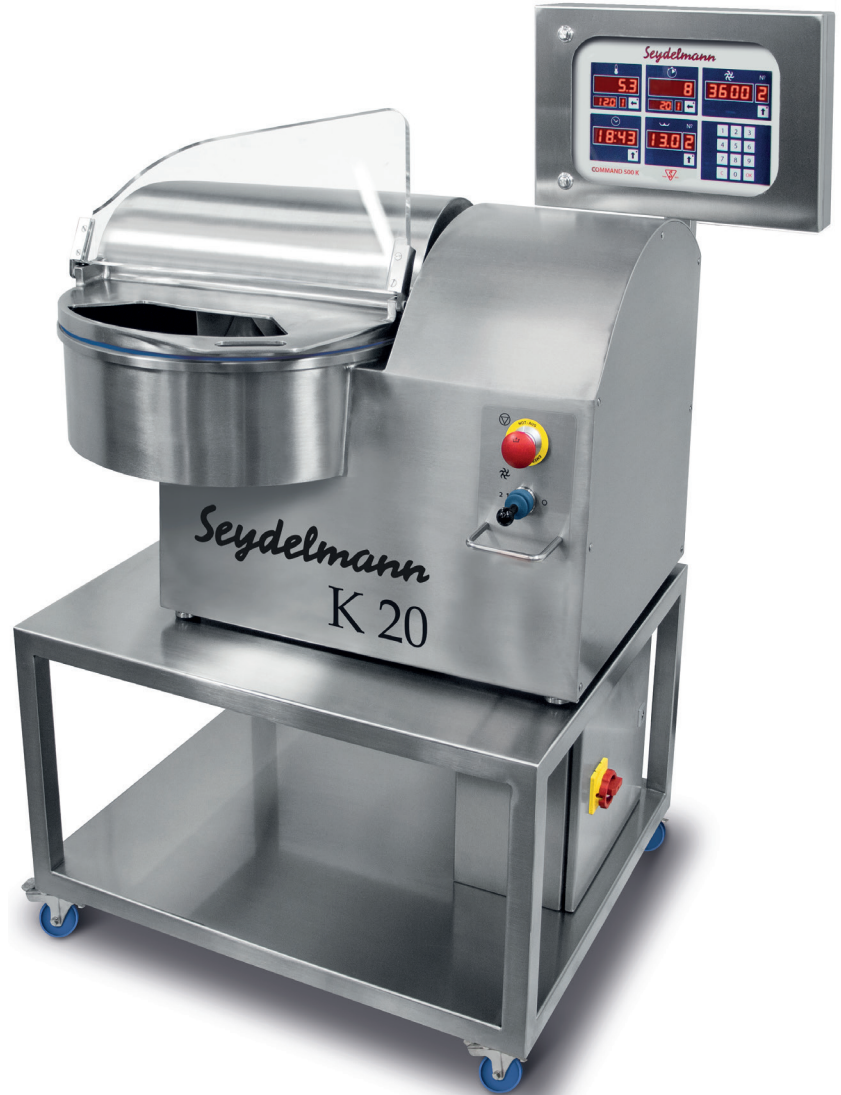
Maße K 20 mit Tisch

K 20: Version 2 Ausführung mit Command 500 und externem Schaltschrank