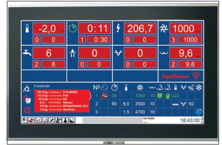
Auto-Command 4000 (optional)